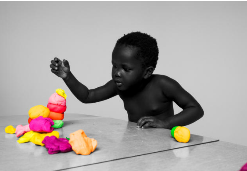
Anyieth at Play, 2019 Rianne van Rompaey / H.A.L. 9000, 2019