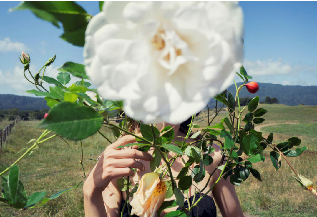
Lou and the Rose, 2018 1 Rose Hip, 1 Dablia, 1 Globe Amaranth, 1 Yellow Turban Buttercup, 2019,