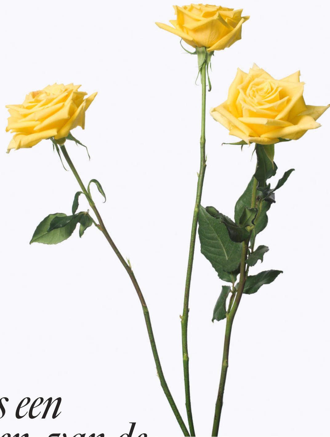
3 Yellow Roses, 2013