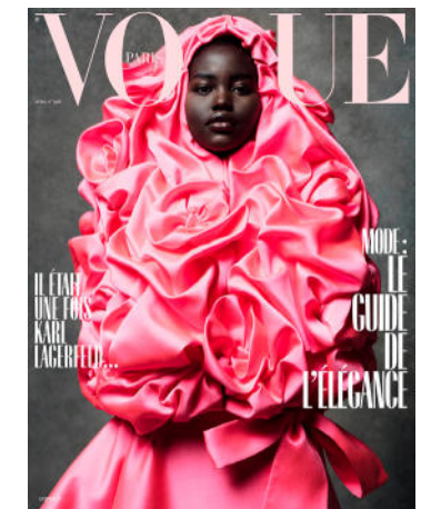
Vogue-covers van Inez en Vinoodb, waaronder hun eerste voor Vogue US (onderste rij, midden)

Met onze 470 duizend volgers op Instagram bereiken we veel meer mensen dan een gemiddeld tijdschrift. Onze werkwijze voor portretten is altijd hetzelfde wat betreft het licht, zodat we de techniek niet meer hoeven te bevragen en we ons puur op de persoon en het contact kunnen richten. Het doel is om iedereen als een held af te beelden en zo haar of zijn kracht om de maatschappij te veranderen te versterken.