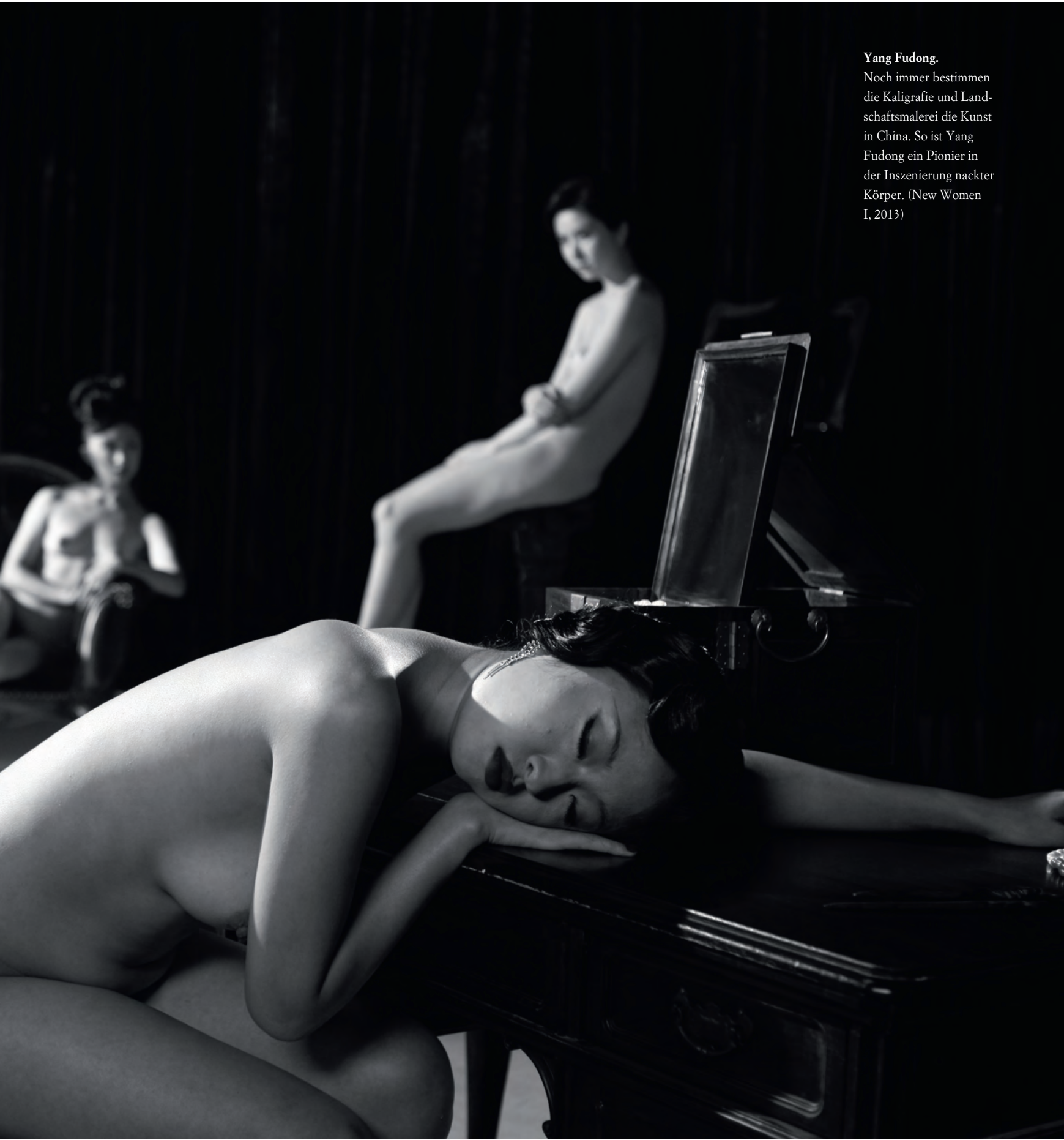
Yang Fudong. Noch immer bestimmen die Kaligrafie und Land- schaftsmalerei die Kunst in China. So ist Yang Fudong ein Pionier in der Inszenierung nackter Körper. (New Women I, 2013)